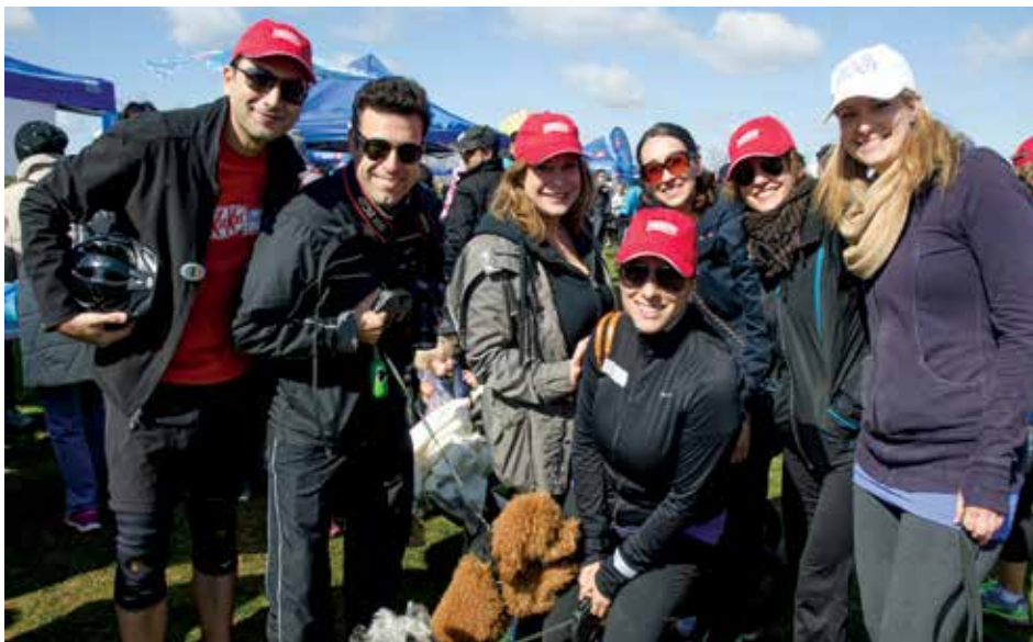
Des employés participent à la marche Faites un pas vers les jeunes

Dans l'ensemble, les divisions canadiennes de Nestlé ont remis plus de 2,5 M$ (dons en nature et en espèces) aux partenaires communautaires et aux programmes, en plus de participer à des collectes de fonds. Cette contribution de notre entreprise est attribuable en grande partie à nos employés, qui n'hésitent pas à donner temps et argent à de nombreuses nobles causes.